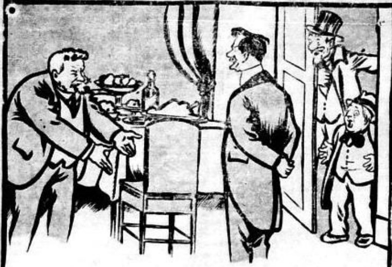
VINTILĂ BRĂTIANU: Și poftim, așază-te acum, să luăm un pahar de vin împreună, că și-a văzut în stăruit vîntul cu ochii...